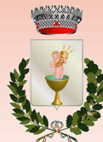
SPEZZANO DELLA SILA