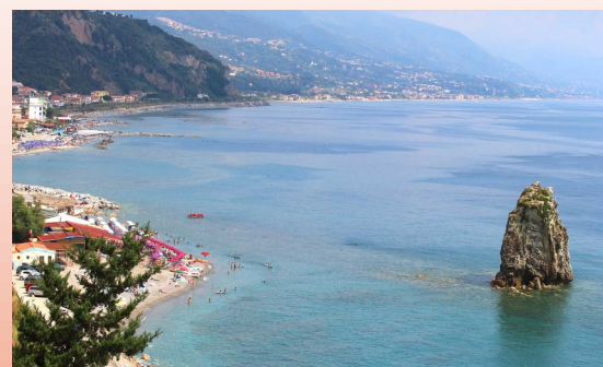
MARE: PAOLA e COSTA TIRRENICA

INFO DETTAGLIATE IN SEDE - PRENOTAZIONI ENTRO IL 15 MARZO 2022