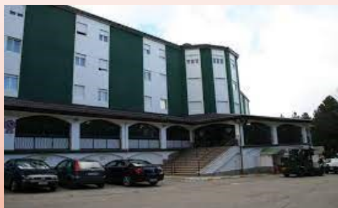
BASE LOGISTICA CAMIGLIATELLO SILANO