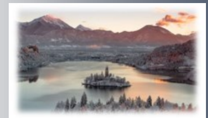
LAGO DI BLED