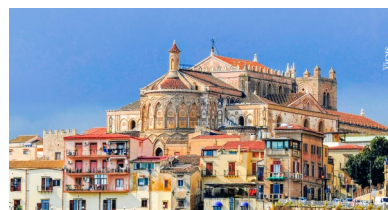
Monreale - La Cattedrale