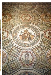
Piazza Armerina - I mosaici