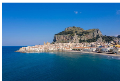
Cefalù - Panorama