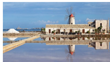
Trapani - Le saline