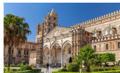
Palermo - La Cattedrale

Giorno 30 Maggio: Partenza ore 08:30 per rientro a Caserta - Sosta a Tindari (ME) - Ore 13:00 pranzo in ristorante convenzionato - Ripartenza e arrivo in sede per le ore 21:00