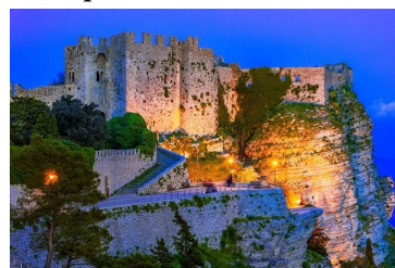
Erice - Visione notturna