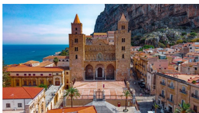
Cefalù - La Cattedrale