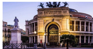
Palermo - Teatro Massimo